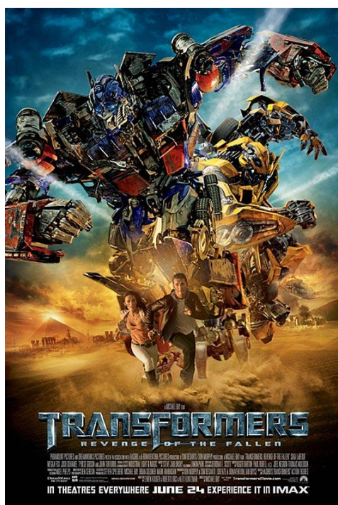
Transformers 2, de Michael Bay, 2009

Le film de Dzhanik Fayziev est donc une réponse au travail de Renny Harlin car son action se situe au moment des événements de 2008. Cependant cette relecture patriotique, est aussi l'occasion de découvrir une approche singulière, comme l'illustre l'affiche du film. « War Zone », titre français assez étrange, est aussi un film de science-fiction. Le triomphe des différents Transformers est passé par là et les robots géants font vendre !